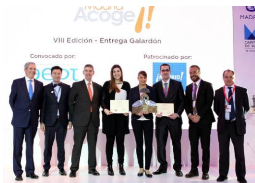
Entrega del Premio Madrid Acoge en su VIII Edición.

El Premio se entregó en el Stand de la ciudad de Madrid en el transcurso de las actividades programadas para la Feria Internacional del Turismo, y el Ayuntamiento empleará la imagen de los finalistas de este Premio para posibles campañas de promoción y marketing del Ayuntamiento de Madrid como destino turístico.