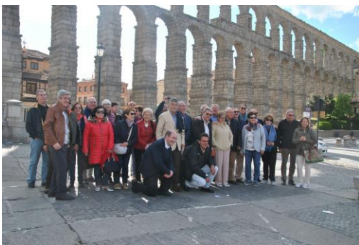
Los asistentes a las Bodas de Oro en su paseo por Segovia.

Por último recordar a los compañeros que ya no están con nosotros y a los que por razones de salud no han podido acompañarnos.